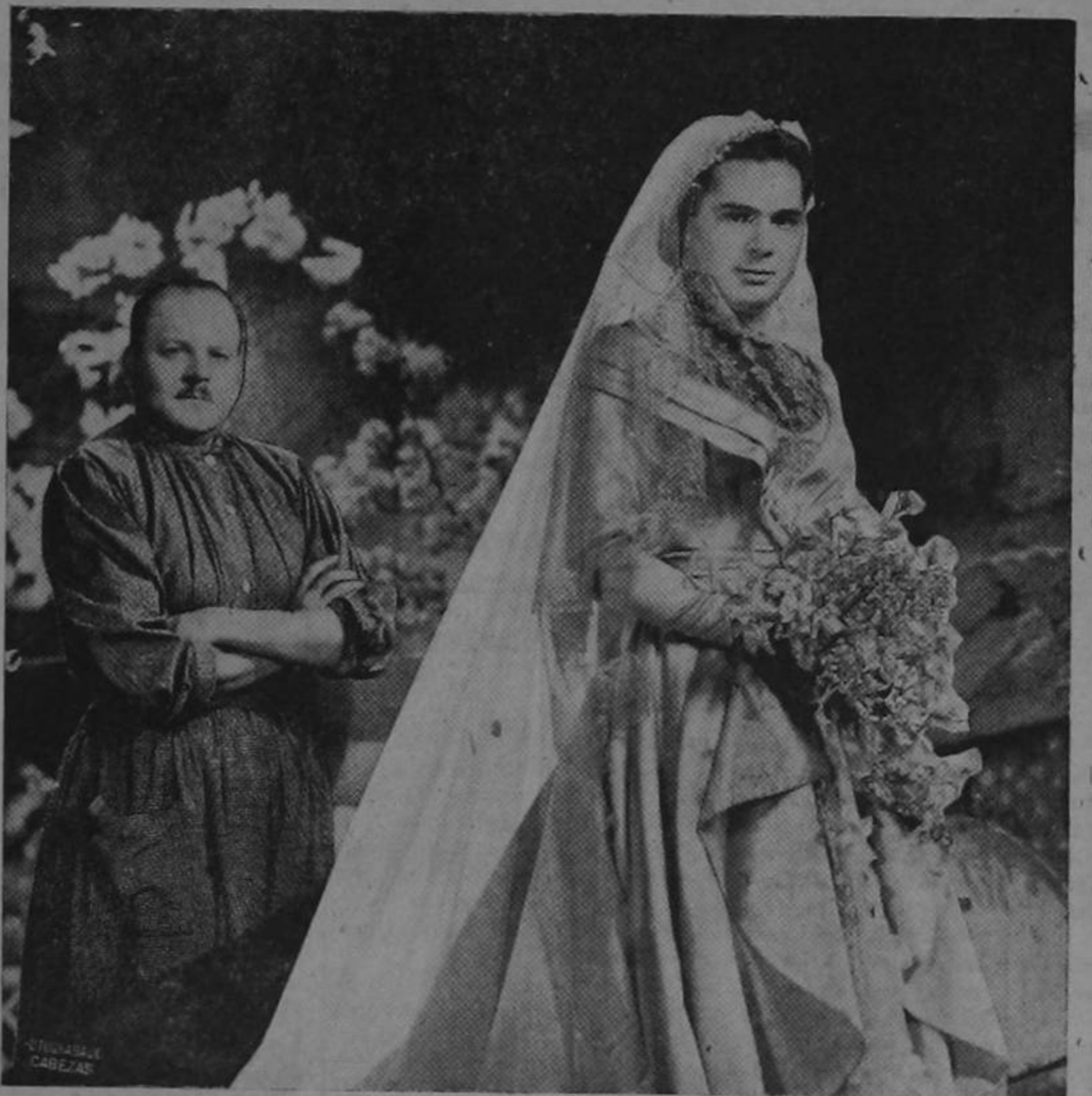
TOLEDO: Ministerio y mortaja, del cielo baja...

(El señor Subsecretario de Economía ha sido elevado al rango de Ministro...)